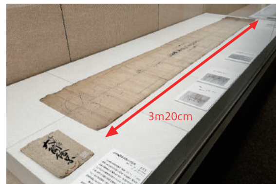
日本鉄炮御由緒大筒絵図(堺市博物館蔵)