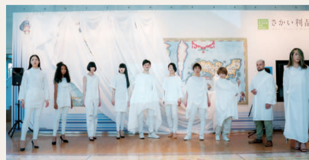
前回のファッションショーの様子

日時 6月9日（日）11～16時 場所 さかい利晶の杜 有料 ワークショップ 問 さかい利晶の杜