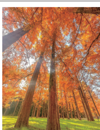
#堺歩き #新檜尾公園