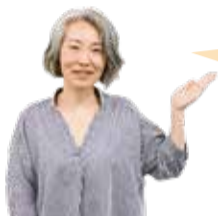
認知症地域支援推進員

3項目以上ある場合はさらに詳しい検査が望ましいと考えられます。かかりつけ医か、問へご相談ください。