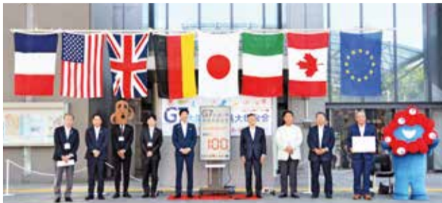
← 会合開催100日前 カウントダウンの 様子(堺市役所)