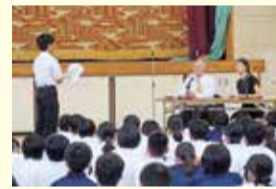
↑特別授業の様子 (日置荘中学校)

G7の閣僚が集う会合が堺で初めて開催されます。世界から注目されるこの機会に、会合のさまざまな場面で、堺や南大阪の魅力を世界中に広く発信します。また市では、次代を担う子ども達が、この機会に多様な文化や考え方にふれられるよう、各国領事館による特別授業や図書館でのブックフェアを実施しています。2学期には「G7学校給食」や「G7あいさつウイーク」、「G7ブックフェア」がスタートします。会合の成功に向け、引き続きさまざまな取組を進めます。皆様のご理解とご協力をお願いします。