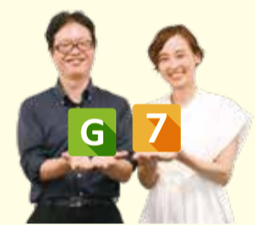
貿易大臣会合協力室職員