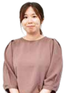
子ども家庭課職員

子どもの成長を支えていくために必要な養育費。ADRを利用して納得できる話し合いをしませんか。