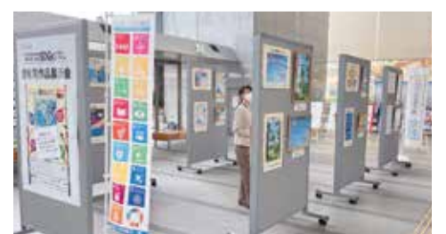
昨年の展示会の様子

受賞した方には表彰式で表彰状と記念品の贈呈を行います。優秀賞に選ばれた作品は市役所で展示予定です。