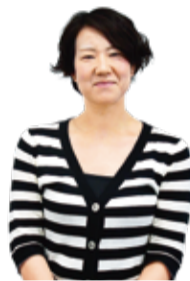
子ども家庭課職員

家族の手伝いで学校生活に影響が出たり、心や体に不調を感じるほど負荷がかかったりする場合は注意が必要です