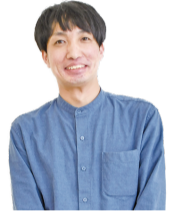
発達障害者支援センター職員

お子さんの行動に対するアドバイスなど、ご家族で安心して生活できるようサポートします!