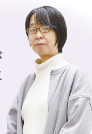
男女共同参画交流の広場カウンセラー

生き方や性に関する事など、さまざまな悩みに自分らしい答えを見つけられるよう、気持ちの整理をお手伝いします。