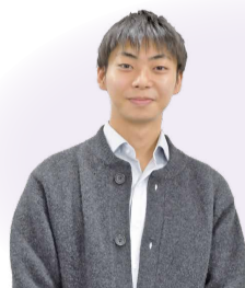
男女共同参画推進課職員

家族の悩み、職場の人間関係、仕事と家庭の両立、心のこと・からだのこと、どんなことでもお聞きします。