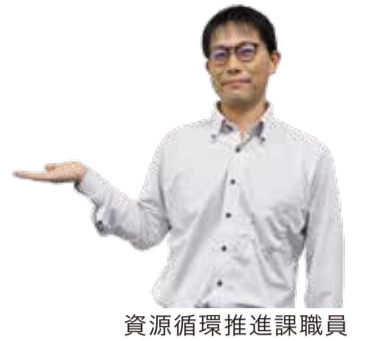
資源循環推進課職員

ごみ処理の過程で排出される二酸化炭素は、地球温暖化や気候変動などの環境問題につながります。ごみを減らすことはとても大切です。