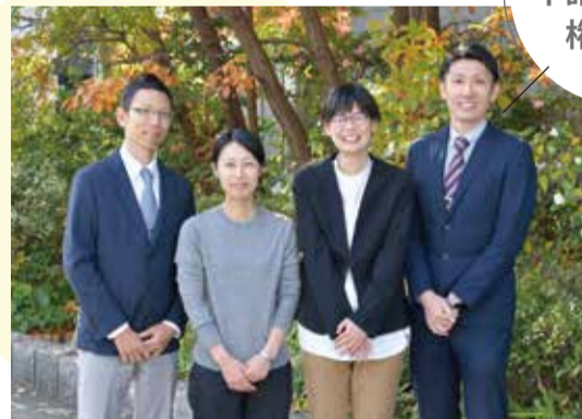
生活援護管理課職員