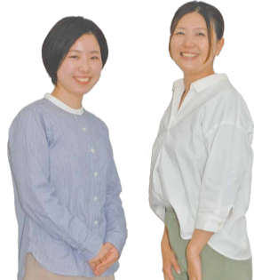
ユースサポートセンター相談員

ゆっくりと自分のペースで話すことから始めませんか あなたが思っていることを教えてください