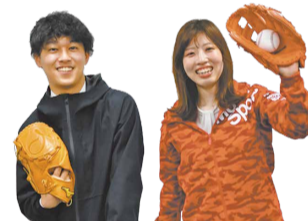
スポーツ推進課職員