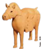
堺市博物館の馬形埴輪