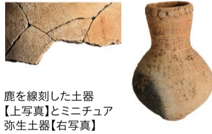
鹿を線刻した土器【上写真】とミニチュア弥生土器【右写真】

石津川流域には多数の遺跡が存在しています。毛穴遺跡や鈴の宮遺跡などの出土品から、弥生時代に暮らした人々の生活を探ります。