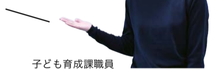
子ども育成課職員