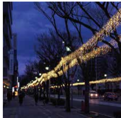
掲載写真は全て昨年度のフォトコンテスト入賞作品です。