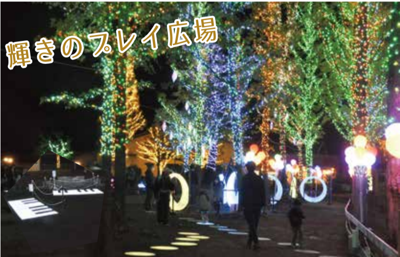
大きいセコイアの木の下で光るブランコやシーソー、音が鳴る光の道は、大人も子どもも一緒に楽しめます。