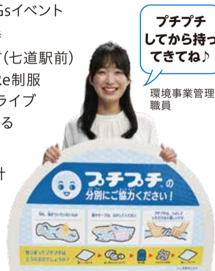
※プチプチは、川上産業株式会社の登録商標です。