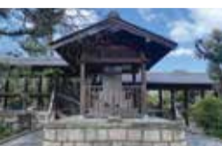
南宗寺の 徳川家康の墓

徳川家康は大坂夏の陣で討ち死にしたという伝説があり、その埋葬地は三好長慶が建立した南宗寺であるとも言われています。