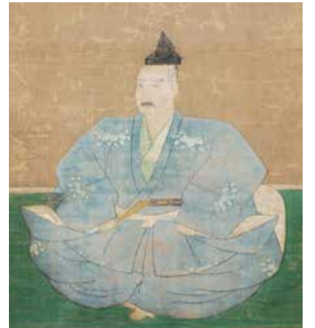
三好長慶(部分)(南宗寺所蔵)