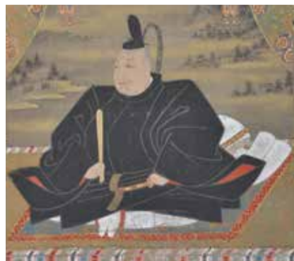
徳川家康(部分)(堺市博物館所蔵)