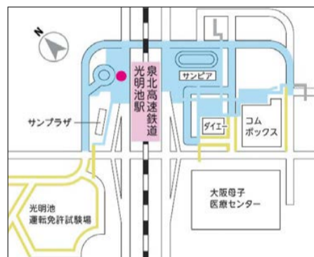
堺市 路上喫煙等マナー向上重点啓発区域 和泉市 路上喫煙規制区域 ● 堺市指定喫煙所

4月1日から新たに光明池駅周辺を「路上喫煙等マナー向上重点啓発区域」に指定します。既に指定している堺東駅西側・中百舌鳥・三国ヶ丘・堺市駅周辺と合わせて重点的に喫煙マナーなどの向上を図ります。同区域での喫煙は、ポイ捨て防止や分煙のために設置予定の喫煙所をご利用ください。