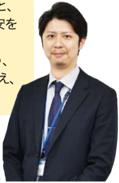
地域共生推進課 職員

くらしの困りごと、仕事の悩み、不安を一緒になって解決できるよう、あなたと共に考え、支援します。