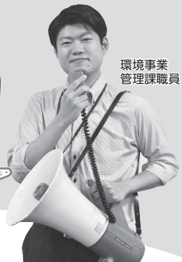
環境事業管理課職員

ごみが増えると、処理施設の負担や温室効果ガスの増加を引き起こすだけではなく、処理経費も増加してしまいます。シリーズの第3弾では、ごみ処理にかかる経費と、その経費をどのようにして工面しているのかについて紹介します。