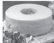
ハーベストの丘の バームクーヘン☎

優秀賞(3点)は「堺産品詰め合わせ」、学生賞(2点)は「ハーベストの丘自家製品詰め合わせ」、入賞者全員に環境に配慮した「森のタンブラー」をプレゼント!