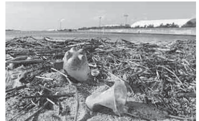
堺浜に漂着したプラスチックごみ