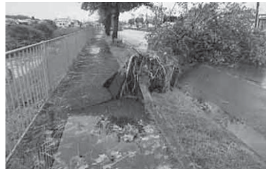
台風の影響を受けて倒れた街路樹