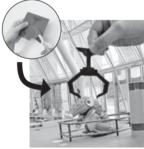
作った切り絵で トリック写真を撮ろう

日程 7月4・11日13時30分~14時、 14時30分~15時、15時30分~16時 各4人(8歳以下は保護者同伴で) ¥100円 当日インフォメーション で受け付け。