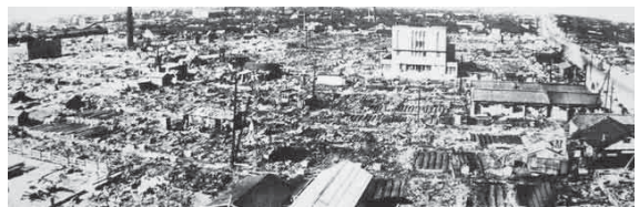
壊滅的被害を受けた当時の堺市の様子(堺区北瓦町付近)

第2次世界大戦では5次にわたる空襲により多くの市民が犠牲となりました。中でも、1945年7月10日の堺大空襲では、一夜にして、1800人以上の命が失われました。戦争を知らない世代が増える中で、当時の体験を後世に語り継ぐことが大切です。戦争の悲惨さや平和の尊さを次世代に伝えていきます。