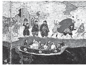
船での見物 当時の堺のまちは海に面していました。浜辺を練り歩く行列には、南蛮人に仮装した人も。船上から見物している人々もいます。