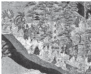
母衣武者(ほろむしゅ) 母衣武者の扮装をした町衆たち。矢よけの防具として使われた母衣ですが、派手な布や大きな飾りを用いて、祭り仕様になっています。