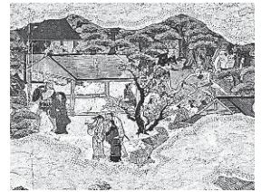
御旅所 御旅所では相撲が行われており、見物の人々ににぎわっています。男たちが女たちに言い寄る姿も見られます。