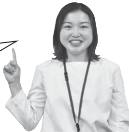
民間活力導入担当職員

公民連携を通して、将来にわたって、市民が安心して暮らすことができ、人も企業にとっても魅力ある堺を創っていただけるよう取り組みを進めていきます！