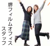
堺フィルムオフィス スタッフ