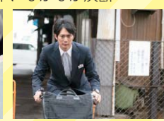
撮影場所：綾之町東商店街