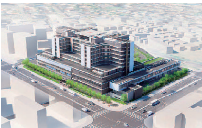
新病院の外観(イメージ)

救急医療と高度専門医療を総合的に提供し、地域医療の核となる新病院(西区家原寺町1丁目)ほかの建設が始まります。平成26年12月末の完成をめざします。 新病院の病床数は487床で、診療科は現病院の診療科に