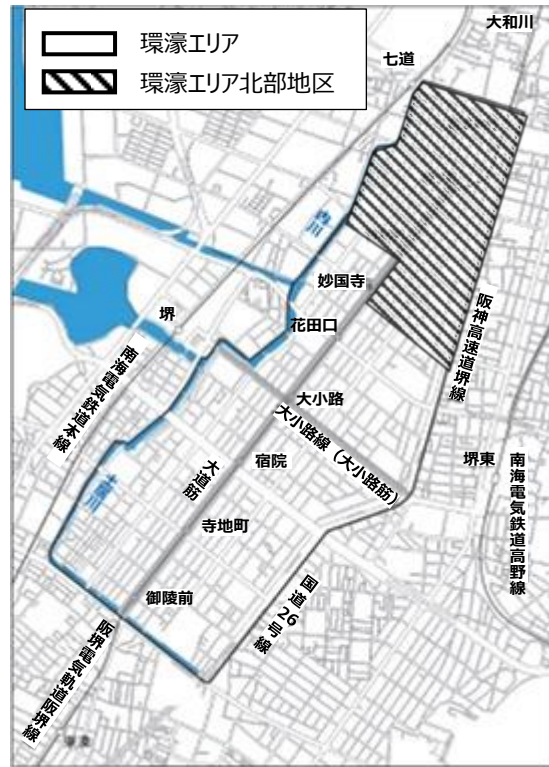
環濠エリア及び環濠エリア北部地区の位置（堺市堺区）