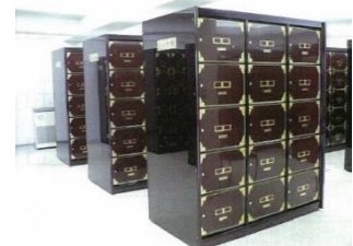
安置室（納骨壇）の例 （平和公園合葬式墓地）