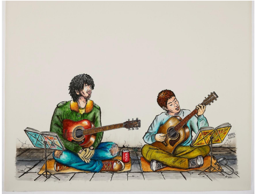
著作権を無償譲渡いただいた「九月八日」イラスト