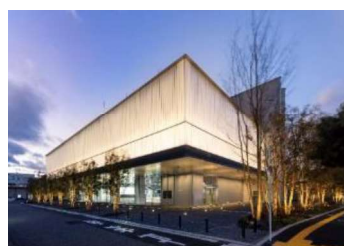
シマノ自転車博物館