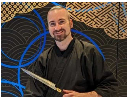
堺刃物ミュージアム「CUT」