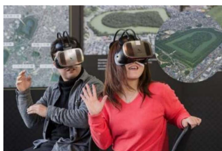
仁徳天皇陵古墳VR体験

仁徳天皇陵古墳VR体験 古代アクセサリーづくり 立礼呈茶で古墳をイメージした和菓子の提供