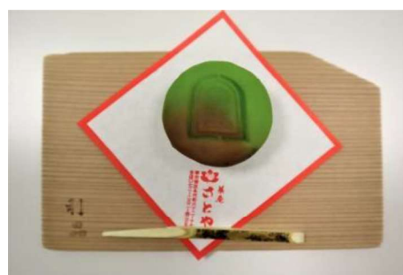
古墳をイメージした和菓子