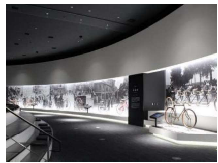
シマノ自転車博物館