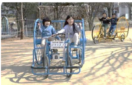
クラシック自転車体験試乗