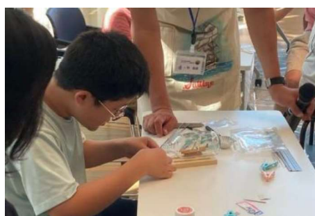
古代アクセサリーづくり