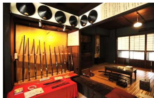
火縄銃レプリカと鉄砲隊衣装で記念撮影