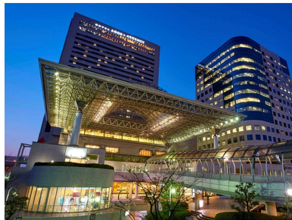
ホテル アゴラ リージェンシー 大阪堺