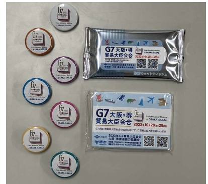
G7 貿易大臣会合 関連グッズの配布