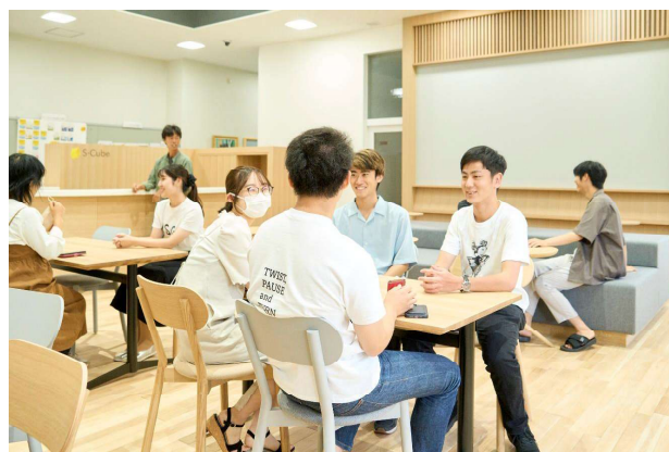
若者向けイベント