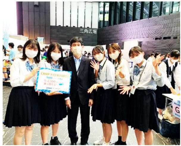
「高校生ボランティアアワード2022」で表彰