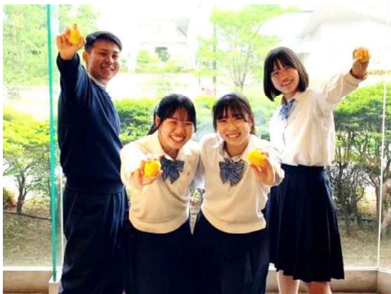
泉北高校生が企画提案