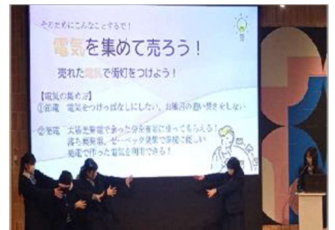
共創実証プロジェクト