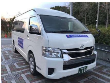
オンデマンドバス