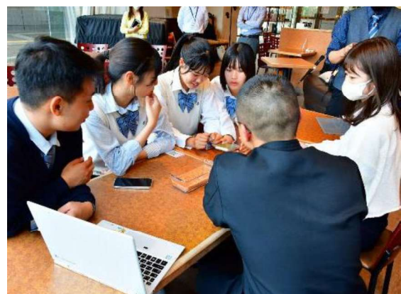
グランディユーとの協議