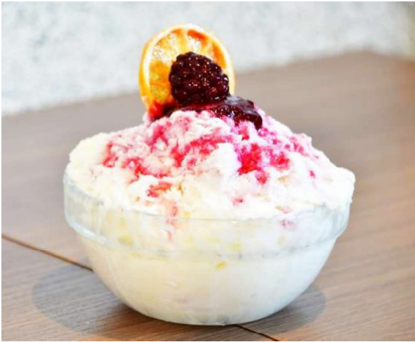
シャリシャリ！爽快！アドレモンヨーグルトかき氷