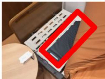
寝具にセンサーを設置