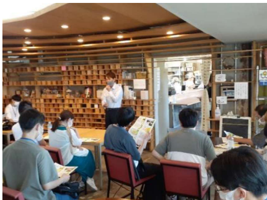
槇塚台レストランでのフィールドワーク