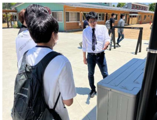
泉北ラボでのフィールドワーク