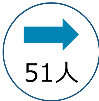
直近1週間の感染経路不明者数