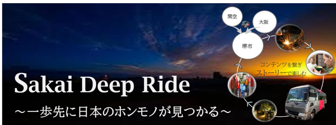
(ツアーのキービジュアル)

また、ツアーによる参加者の観光消費を生み出すことに加え、SNS や販売ページへのリーチ数、国別の人気コンテンツ、実際に堺に訪れたインバウンドのアンケートによる生の声、ツアー参加者の消費額といった情報を収集し、今後のインバウンド向け観光施策の更なる推進をめざします。なお、令和7年度以降は今回の実証を踏まえ、同社が自社商品として継続的に展開予定です。