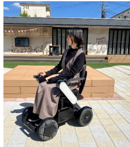
WHILL Model C2