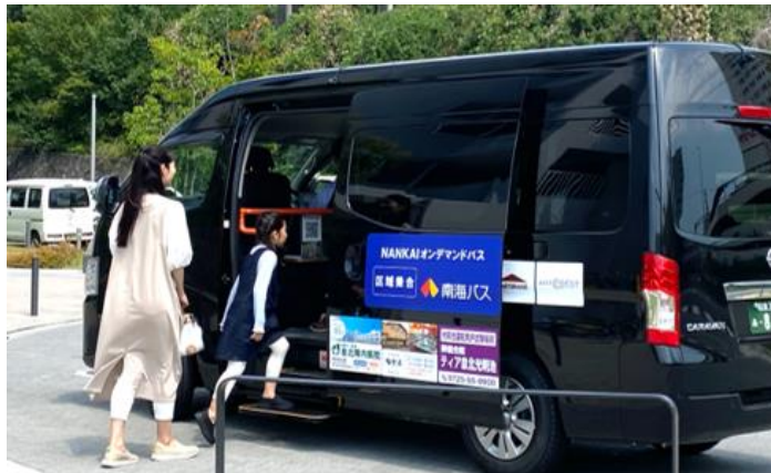
オンデマンドバス車両