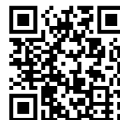
近畿管区行政評価局 ホームページ