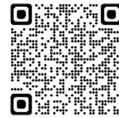
行政相談委員 オフィシャルウェブサイト

◇お問合せは、総務省 近畿管区行政評価局 行政相談課 (TEL：06-6941-8358) まで