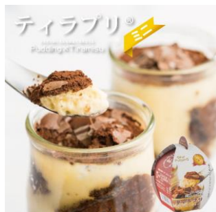
(株)ジョウリュウのティラプリ®