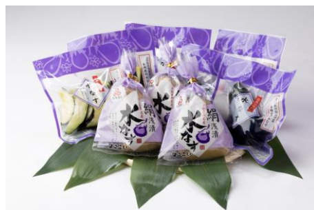
水なす工房よさこいの水なす