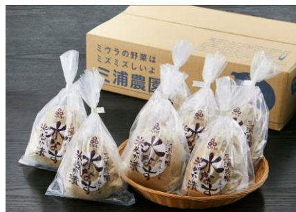
三浦農園の水なす