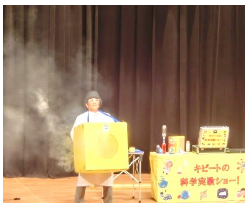
【特別科学イベント】