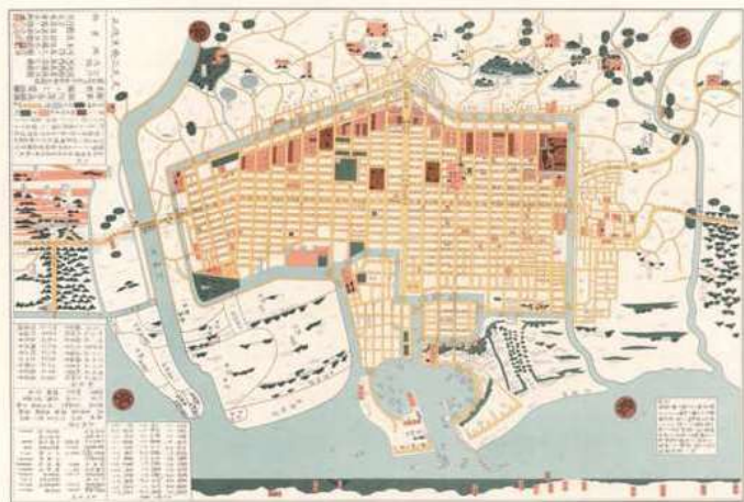
文久改正堺大絵図

町の周囲にめぐらせた堀のことをいいます。中世の堺は国際貿易都市として繁栄しました。「会合衆」と呼ばれる豪商たちが、戦乱から町を守り、住民の自治を保つために堀をめぐらせた「環濠都市」を形づくりしました。大坂夏の陣で豊臣方に焼き討ちにあいますが、徳川幕府の都市計画(元和の町割り) げんな のもと、復活します。現在は、内川・土居川・土居川公園に囲まれた南北3km、東西1kmにおよぶエリアを“環濠エリア”と呼んでいます。今も江戸時代～戦前の建築物やまちなみの一部が残されており、400年以上前から続く地域の歴史に思いをはせることができます。