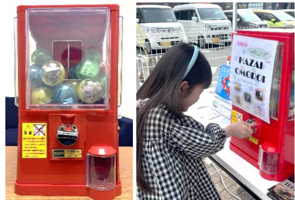
(端材ガチャの写真)

※令和6年4月6日（土）にアクロスモール泉北で 開催された「SDGs マルシェ」で試験的に設置しました。