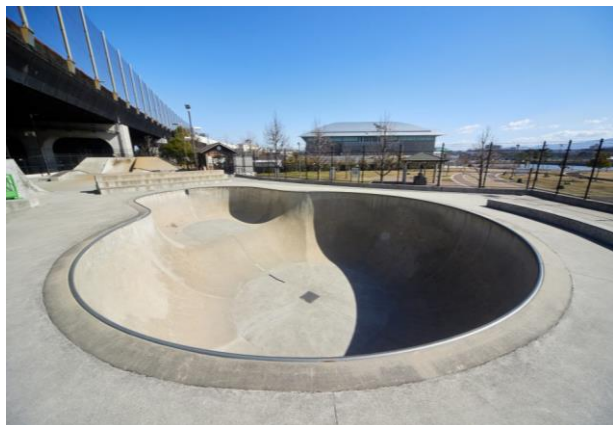
原池公園スケートボードパーク内、第1パーク