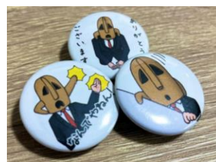
堺市オリジナルグッズ （ハニワ部長缶バッジ）