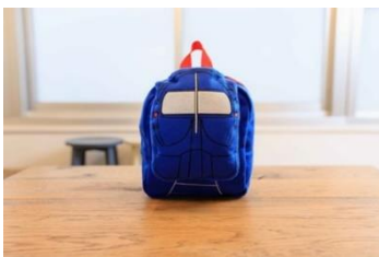
A 賞品 （ラポートキッズリュック）

B：ラポート象印ステンレスマグ+泉北高速鉄道せんぼくんノベルティ+堺市オリジナルグッズ…10 名様