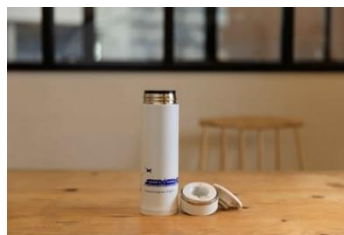
B 賞品 （ラポート象印ステンレスマグ）