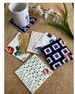
堺市オリジナルグッズ （注染コースター）

※応募・当選及び発送に伴う注意事項等は、応募フォーム（ https://babycal-jre.com ）でお確かめください。