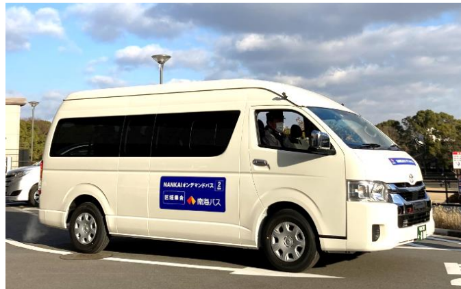
AI オンデマンドバス運行車両

なお、当実証事業の AI オンデマンドバスシステムは J:COM が提供します。J:COM では社内営業員向けライドシェアサービス「J:COM MaaS」を令和 2 年 7 月より開始し、堺市を含む全国 21 拠点（令和 5 年 9 月現在）で展開しており、運用開始から 3 年間で蓄積された AI オンデマンドシステムのデータや運用ノウハウを活用します。