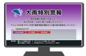
【テレビ表示イメージ】

株式会社ジェイコムウエスト 0120-989-989（受付時間：午前 9 時～午後 6 時 年中無休）