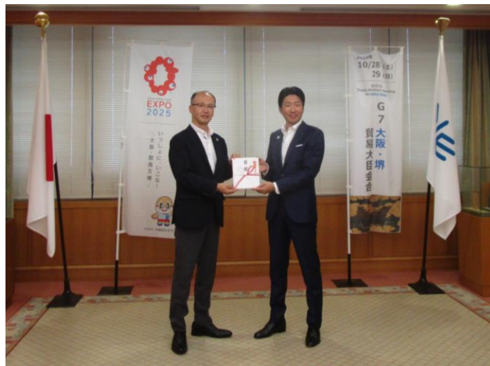
株式会社ダイエー 笹田人事総務本部長