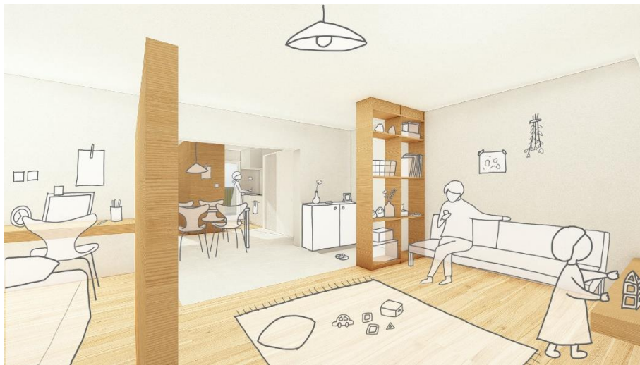
イメージパース（Bタイプ）

今後も、府公社が実施する住戸リノベーション業務への広報連携等により、子育て世帯など若年層の多様なニーズに対応する魅力的な住宅を供給することで地域活性化を図ります。